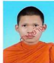
พระภิกษุและสามเณร