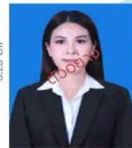
นักศึกษาหญิง