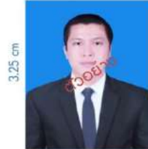
นักศึกษาชาย