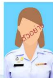
ทหารหญิง